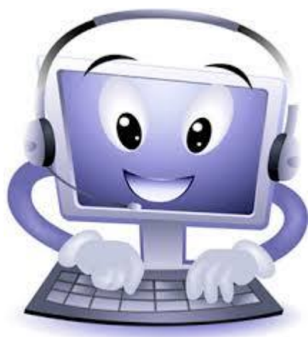
Učitelj: Mitja Zotti

Vsak učenec oz. skupina učencev si izbere temo iz področja, ki jih zanima in izdelava računalniško predstavitev, ki jo na koncu predstavijo pred razredom.