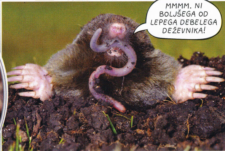
Na leto krt poje tudi do 25 kilogramov deževnikov

Krt si izkoplje različne vrste votlin in rogov. Tik pod površino so rovi, v katerih se hrani. Večina teh rogov so v resnici le pasti za deževnike. V do tri metre globokih tunelih pa je krtov dom. V njem je prostor za počitek, gnezdenje in shramba. Brez hrane zdrži do 24 ur. V tem času lahko prigrizne ostanke deževnikov, ki jih je pospravil v shrambo.