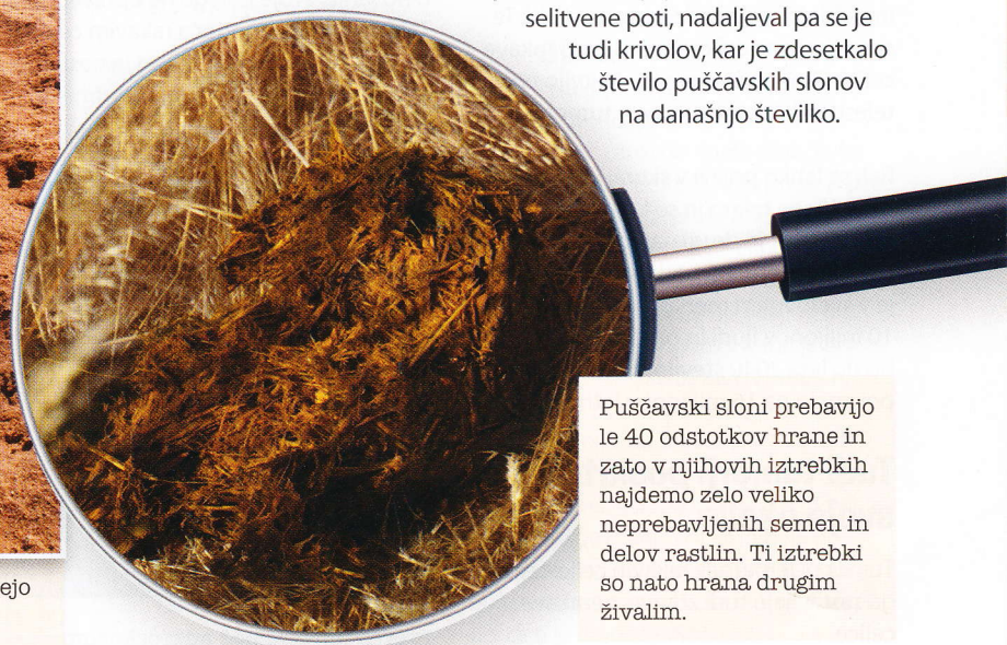
Puščavski sloni prebavijo le 40 odstotkov hrane in zato v njihovih iztrebkih najdemo zelo veliko neprebavljenih semen in delov rastlin. Ti iztrebki so nato hrana drugim živalim.

Danes v Namibu živi le še približno 150 puščavskih slonov. Pa ni bilo vedno tako. V 18. stoletju naj bi jih bilo med 2500 in 3500. Zaradi lova in krivolova se je njihova populacija zelo zmanjšala konec 19. stoletja, v osemdesetih letih prejšnjega stoletja jih je bilo le še 360. Vse večja naseljenost območja je presekala njihove selitvene poti, nadaljeval pa se je tudi krivolov, kar je zdesetkalo število puščavskih slonov na današnje številk.