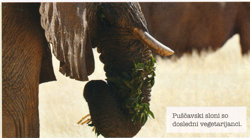
Puščavski sloni so dosledni vegetarijanci.

svoje ogromno telo zelo veliko vode, odrasli sloni okrog 170 litrov na dan, morajo skopati zelo veliko lukenj.