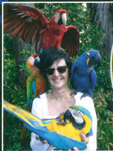
Zdi se, da sem tudi jaz vseč tem neverjetnim pticam.

Telo škrlatne are je veliko približno 30 centimetrov in tehta kakšen kilogram. Ta papiga ima bel obraz ter rumeno, rdeče, zeleno in modro perje. Z velikim in močnim kljunom zlahka razbija oreške in semena. Pri hranjenju ji pomaga tudi luskast jezik, ki ga most v notranjosti spreminja v učinkovit jedilni pribor. Z oprijemalnimi prsti zgrabi in drži predmete, da si jih lahko natančno ogleda.