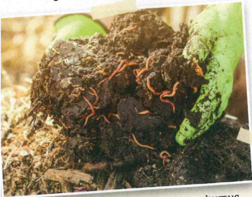
Deževniki organsko snov spreminjajo v humus.

je deževnike na skrajni sever planeta nedvomno prinesel človek. Postopoma so deževniki začeli spreminjati v humus ostanke tamkajšnjih redkih rastlin. Zaradi delovanja deževnikov so rastline na Arktiki začele rasti tako dobro, kot da bi se temperatura ozračja dvignila za 3 °C. Z več rastlinske pokritosti tal pa se je začelo povečevati tudi taljenje snega in večnega ledu.